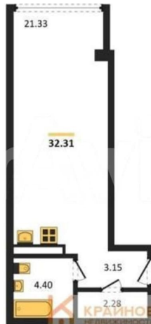
КОРПУС 1 (Секции 4-8) Секция 8 План 2-11 этажей