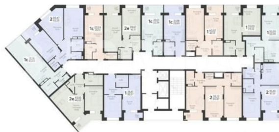
КОРПУС 1 (Секции 4-8) Секция 8 План 2-11 этажей