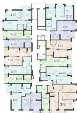
КОРПУС 1 Секция 1 План 2-19 этажей

прилегающей территории предусмотрена парковка в виде открытых организованных площадок, что поможет избежать парковки в непредусмотренных местах. ФИКСАЦИЯ СТОИМОСТИ КВАРТИРЫ НА ПЕРИОД ПРОДАЖИ ВАШЕЙ НЕДВИЖИМОСТИ! БЕСПЛАТНОЕ ОДОБРЕНИЕ ИПОТЕКИ И СОПРОВОЖДЕНИЕ СДЕЛКИ ДО ПОЛУЧЕНИЯ КЛЮЧЕЙ! ВОЗМОЖНО ИСПОЛЬЗОВАНИЕ ВСЕХ СЕРТИФИКАТОВ ГОСУДАРСТВЕННОГО ОБРАЗЦА! ЗВОНИТЕ ПРЯМО СЕЙЧАС!