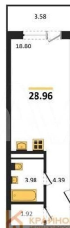
КОРПУС 1 (секции 1-3) Секция 2 План 2-11 этажей