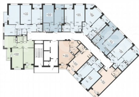
1 СЕКЦИЯ 15-19 ЭТАЖИ