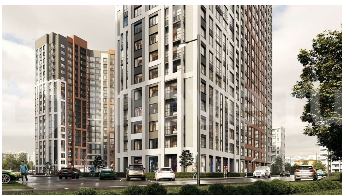
Жилой комплекс Чехов

документов до регистрации права собственности; - Консультация и подбор удобного объекта в любое УДОБНОЕ ВРЕМЯ; Возможно, вы искали: купить квартиру студию, купить однушку, купить двушку, купить трешку, акции и скидки на новостройки, квартира в на левом берегу, купить квартиру на левом берегу, купить квартиру в ипотеку на левом берегу, квартира в левобережном районе, купить квартиру в левобережном районе, новостройка в левобережном районе, новостройка на левом берегу, купить квартиру в новом доме, купить квартиру в Воронеже, квартира ЖК Чехов, купить квартиру в ЖК Чехов, стоимость квартиры на левом берегу, квартира в Воронежской области, купить квартиру в Воронежской области, квартиры в новостройке с паркингом, квартиры от застройщика без посредников, недвижимость Воронеж, инвестиции купить квартиру в новостройке, новостройки сменить квартиру, квартиры в строящемся доме, новостройки с отделкой, первичное жилье в новостройке, квартиры в новостройке без посредников, новостройки с рассрочкой, квартиры в новостройке с большой площадью, новостройки эконом класса, новостройки комфорт класса, новостройки бизнес класса, купить квартиру в новом доме. - Квартира №201