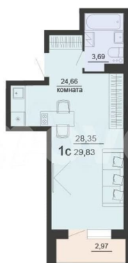
Жилой комплекс Чехов

документов до регистрации права собственности; - Консультация и подбор удобного объекта в любое УДОБНОЕ ВРЕМЯ; Возможно, вы искали: купить квартиру студию, купить однушку, купить двушку, купить трешку, акции и скидки на новостройки, квартира в на левом берегу, купить квартиру на левом берегу, купить квартиру в ипотеку на левом берегу, квартира в левобережном районе, купить квартиру в левобережном районе, новостройка в левобережном районе, новостройка на левом берегу, купить квартиру в новом доме, купить квартиру в Воронеже, квартира ЖК Чехов, купить квартиру в ЖК Чехов, стоимость квартиры на левом берегу, квартира в Воронежской области, купить квартиру в Воронежской области, квартиры в новостройке с паркингом, квартиры от застройщика без посредников, недвижимость Воронеж, инвестиции купить квартиру в новостройке, новостройки сменить квартиру, квартиры в строящемся доме, новостройки с отделкой, первичное жилье в новостройке, квартиры в новостройке без посредников, новостройки с рассрочкой, квартиры в новостройке с большой площадью, новостройки эконом класса, новостройки комфорт класса, новостройки бизнес класса, купить квартиру в новом доме. - Квартира №201