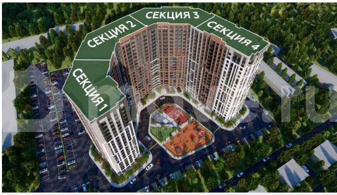
Жилой комплекс Чехов