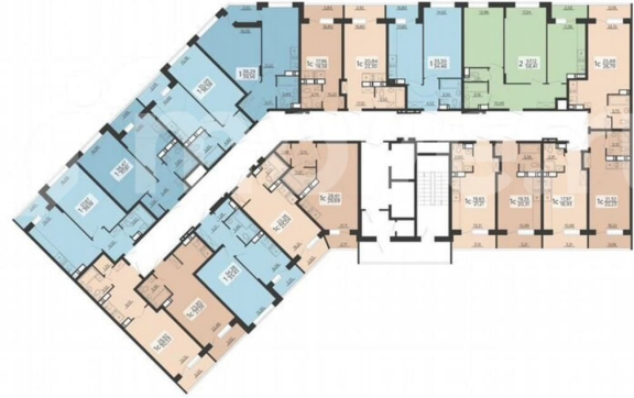
2 СЕКЦИЯ 13 ЭТАЖ