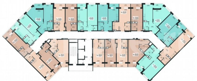
3 СЕКЦИЯ 2-20 ЭТАЖ