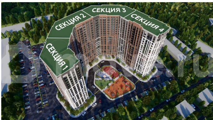
Жилый комплекс Чехов

документов до регистрации права собственности; - Консультация и подбор удобного объекта в любое УДОБНОЕ ВРЕМЯ; Возможно, вы искали: купить квартиру студию, купить однушку, купить двушку, купить трешку, акции и скидки на новостройки, квартира в на левом берегу, купить квартиру на левом берегу, купить квартиру в ипотеку на левом берегу, квартира в левобережном районе, купить квартиру в левобережном районе, новостройка в левобережном районе, новостройка на левом берегу, купить квартиру в новом доме, купить квартиру в Воронеже, квартира ЖК Чехов, купить квартиру в ЖК Чехов, стоимость квартиры на левом берегу, квартира в Воронежской области, купить квартиру в Воронежской области, квартиры в новостройке с паркингом, квартиры от застройщика без посредников, недвижимость Воронеж, инвестиции купить квартиру в новостройке, новостройки сменить квартиру, квартиры в строящемся доме, новостройки с отделкой, первичное жилье в новостройке, квартиры в новостройке без посредников, новостройки с рассрочкой, квартиры в новостройке с большой площадью, новостройки эконом класса, новостройки комфорт класса, новостройки бизнес класса, купить квартиру в новом доме. - Квартира №847