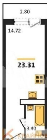
КОРПУС 2 Секция 2 План 2-19 этажей