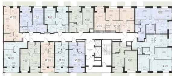
КОРПУС Секции 5-8 Секция 7 План 2-9 этажей