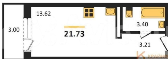
КОРПУС 1 Секция 4 План 2-19 этажей