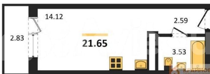
КОРПУС 1 Секция 4 План 2-19 этажей

прилегающей территории предусмотрена парковка в виде открытых организованных площадок, что поможет избежать парковки в непредусмотренных местах. ФИКСАЦИЯ СТОИМОСТИ КВАРТИРЫ НА ПЕРИОД ПРОДАЖИ ВАШЕЙ НЕДВИЖИМОСТИ! БЕСПЛАТНОЕ ОДОБРЕНИЕ ИПОТЕКИ И СОПРОВОЖДЕНИЕ СДЕЛКИ ДО ПОЛУЧЕНИЯ КЛЮЧЕЙ! ВОЗМОЖНО ИСПОЛЬЗОВАНИЕ ВСЕХ СЕРТИФИКАТОВ ГОСУДАРСТВЕННОГО ОБРАЗЦА! ЗВОНИТЕ ПРЯМО СЕЙЧАС!