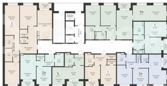
КОРПУС 2 Секция 2.2 План 2-10 этажей