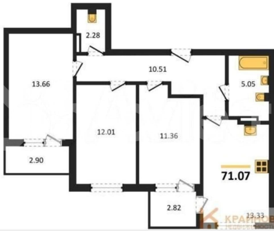
КОРПУС 1 Секция 2 План 2-13 этажей