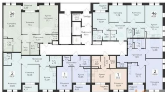
КОРПУС 1 Секция 1.3 План 2-16 этажей

комнаты, смещать стены, выстраивать ниши для встроенной мебели или техники. На каждом этаже мы предусмотрели кладовые комнаты для хранения сезонных вещей. Жилой комплекс оснащен собственной котельной, что дает возможность жителям самостоятельно устанавливать тепловой режим и выбрать для себя максимально комфортную температуру, а также не зависеть от отключения отопления. Система интеллектуального учета: вам не придется каждый месяц передавать данные с приборов учета, благодаря умным счетчикам, установленным в каждой квартире, они будут передаваться автоматически. Разводка труб отопления в квартирах выполнена в стяжке пола: ваше пространство для жизни остается объемным и свободным. Круглосуточное видеонаблюдение. На территории ЖК гостевая парковка, а для жильцов предусмотрен подземный паркинг. Въезд внутрь осуществляется через автоматические ворота по программируемому ключу. Автовладельцы смогут попасть в свою квартиру прямо из паркинга на лиф СЕМЕЙНАЯ ИПОТЕКА! ВОЕННАЯ ИПОТЕКА! СОПРОВОЖДЕНИЕ СДЕЛКИ ДО ПОЛУЧЕНИЯ КЛЮЧЕЙ! УСПЕЙТЕ КУПИТЬ ДО ПОВЫШЕНИЯ ЦЕНЫ! ЗВОНИТЕ!