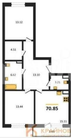
КОРПУС 2 Секция 1 План 3-13 этажей