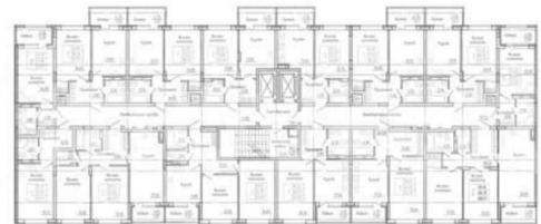
КОРПУС 2 (Секция 2) Секция 2 План 2-18 этажей