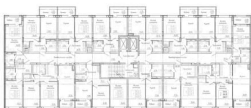
КОРПУС 2 (Секция 2) Секция 2 План 2-18 этажей

первых этажей, а также дворовое пространство, способное объединить активных жителей и их детей. В шаговой доступности от ЖК уже есть вся необходимая инфраструктура, а на ключевых маршрутах транспорта легко добраться до вузов и крупных ТЦ, не более чем за полчаса. Рядом с ЖК: школы, детские сады, магазины, аптеки, бассейн, детская площадка. БЕСПЛАТНОЕ ОДОБРЕНИЕ ИПОТЕКИ И СОПРОВОЖДЕНИЕ СДЕЛКИ! ЗВОНИТЕ!!!