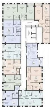
КОРПУС 1 Секция 1.1 План 2-12 этажей

комнаты, смещать стены, выстраивать ниши для встроенной мебели или техники. На каждом этаже мы предусмотрели кладовые комнаты для хранения сезонных вещей. Жилой комплекс оснащен собственной котельной, что дает возможность жителям самостоятельно устанавливать тепловой режим и выбрать для себя максимально комфортную температуру, а также не зависеть от отключения отопления. Система интеллектуального учета: вам не придется каждый месяц передавать данные с приборов учета, благодаря умным счетчикам, установленным в каждой квартире, они будут передаваться автоматически. Разводка труб отопления в квартирах выполнена в стяжке пола: ваше пространство для жизни остается объемным и свободным. Круглосуточное видеонаблюдение. На территории ЖК гостевая парковка, а для жильцов предусмотрен подземный паркинг. Въезд внутрь осуществляется через автоматические ворота по программируемому ключу. Автовладельцы смогут попасть в свою квартиру прямо из паркинга на лиф СЕМЕЙНАЯ ИПОТЕКА! ВОЕННАЯ ИПОТЕКА! СОПРОВОЖДЕНИЕ СДЕЛКИ ДО ПОЛУЧЕНИЯ КЛЮЧЕЙ! УСПЕЙТЕ КУПИТЬ ДО ПОВЫШЕНИЯ ЦЕНЫ! ЗВОНИТЕ!